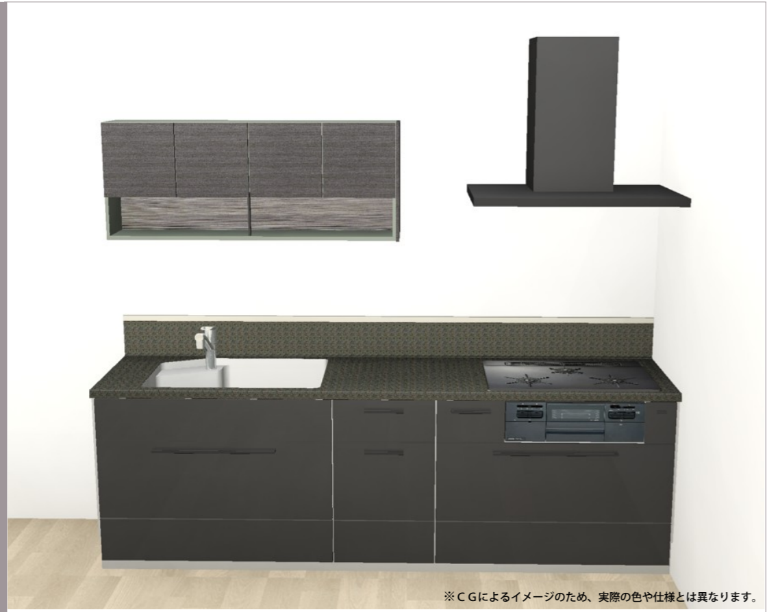
※CGによるイメージのため、実際の色や仕様とは異なります。

選択色 ※1 現在選択中の色を□(赤枠)で囲んでいます。 ※2 色を未選択の場合や色変更は、表示している色よりお選びください。