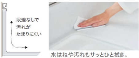
水はねや汚れもサッとひと拭き。