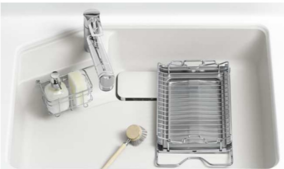
コンロのグリル部分もタテにすっぽり入ります。

※2020年10月 当社調べ 国内の主要システムキッチンメーカーにおける標準シンク