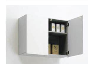
開き扉キャビネット 取手レス仕様 アッパーロック 可動棚