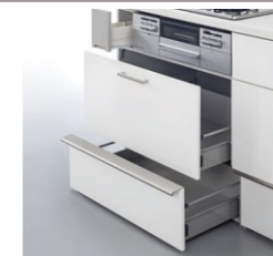
フロアスライド ショックアブソーバー ・コンロ横小引出し ※小引出しの個数は間口により異なります。