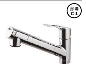
浄水器内蔵シャワー混合水栓 AWJSA2H5K(K) (トクラス製)