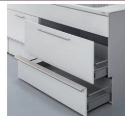
フロアスライド ショックアブソーバー 包丁差し