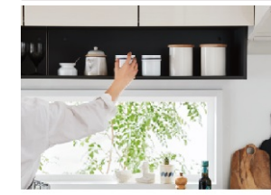
オープンウォール