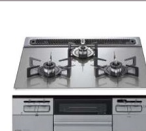
W600 ガラストップ3口コンロ W3V6WTP2VE (ハーマン製)