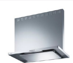
薄型フードASR/シルバー H700用 ASR3A9027 (R/L) SY