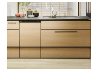
フロア材と相性が良い、フロアスライド部分も扉同一仕上げ。