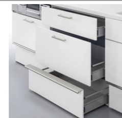
3段フロアスライド ショックアブソーバー