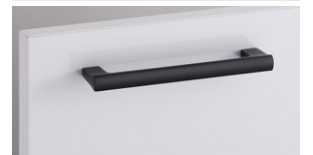
キッチンにアクセントを加える マットで端正な取手デザイン。